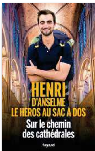
Sur le chemin des cathédrales Par Henri d'Anselme Fayard (2024)

Diplômé en philosophie et en management international, le jeune pèlerin s'était lancé le défi de parcourir la France pendant neuf mois en 2023 sur le chemin des 180 cathédrales (130 visitées).