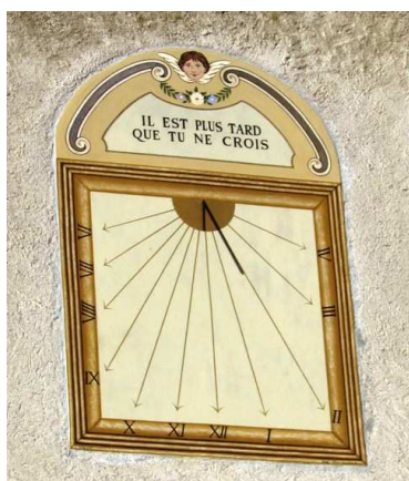
Cadran solaire sur la façade Sud

La façade est rythmée par quatre pilastres, les niches avec St Pierre, le Bon Pasteur et St Paul et une serlienne en tuf.