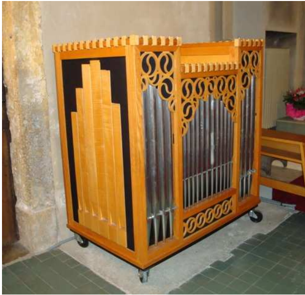
Orgue à quatre jeux et petit clavier d'épinette sur roulettes