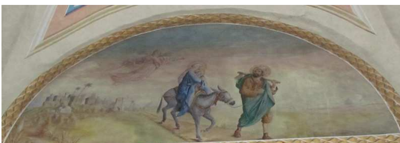
Peinture naïve : La fuite en Égypte

Les voûtes sont recouvertes de fresques bibliques, peintes par Clément Giacobini en 1850. Repeintes en 1926 et 1956, elles ont été restaurées en 1992-1993 par l'entrepreneur Valsésia