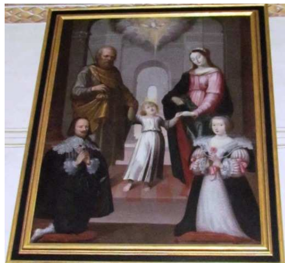
Tableau de la Sainte Famille , vers 1650 entre les deux arcs du fond de l'église. Ce tableau a été offert par les époux De Riddes qui figurent sur le bas du tableau

Les fonds baptismaux datent du 17 ème siècle. La cuve en granit est encastrée dans le mur. Elle est coiffée d'une armoire à panneaux rouges et verts, en bois sculpté et peint, surmontée de volutes et d'une croix.