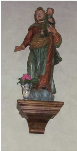
La Vierge à l'Enfant

Du point de vue historique : St Théodule, patron de cette église de Flumet, rencontra St Ambroise au Concile d'Aquilée en 381. Il baptisa St Augustin en 386. Ils se connaissent et leurs statues ont donc leur signification dans l'église.