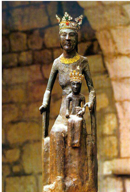
Vierge noire de Rocamadour