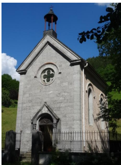
Chapelle du Bienheureux Jean d'Espagne