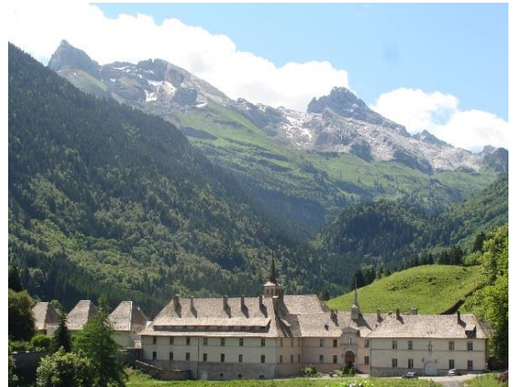
Carmel, ancienne Chartreuse