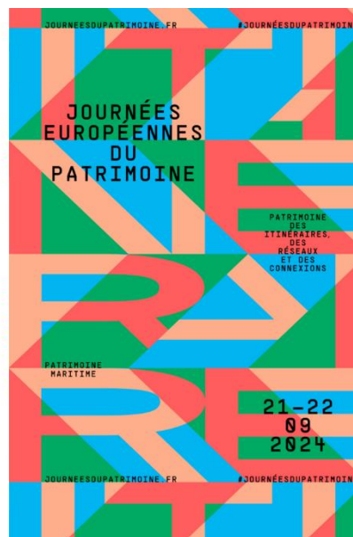
Affiche JEP 2024