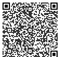
Sts Pierre et Paul