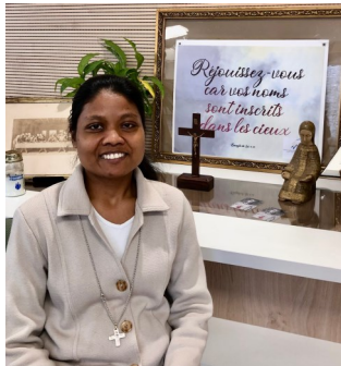
P. 6 une nouvelle arrivée chez les sœurs de la croix