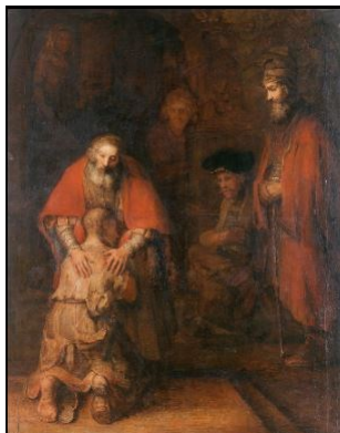
PP. 10 & 11 Enseignement