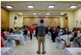
PP.3 & 4 Repas solidaire du 21 décembre