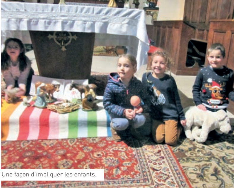
Une façon d'impliquer les enfants.