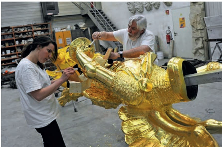
Au travail, sur l'archange du Mont Saint Michel.

Le métier de doreur ne s'exerce pas seulement dans les monuments historiques ; nous travaillons également avec des artistes, des designers, des architectes, des décorateurs d'intérieur, etc., ce qui rend la dorure à la fois ancestrale et contemporaine.