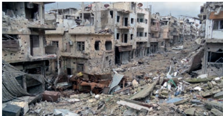
Homs, ville martyre.

Je devais accompagner ma fille de 20 ans à l'aller et au retour du collège pour qu'on ne l'enlève pas. 35 hommes de ma famille (dont mon mari et des beaux-frères) et 5 femmes ont été enlevés par la sécurité, et emprisonnés.