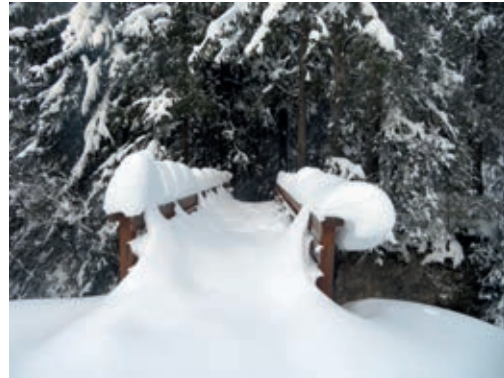
Un passage difficile? Ou un chemin à découvrir?

Toutes les générations vivent des passages compliqués, les pages du livre ne sont pas tou-