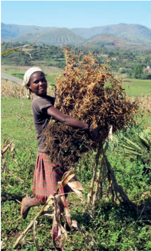
Assurer les besoins fondamentaux de tous.