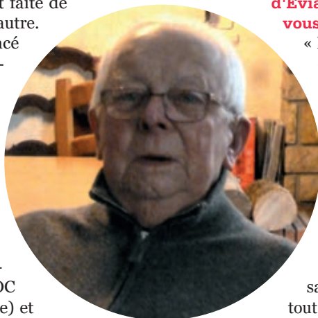
Fidèle à Jésus, à l'écoute des autres.

« Ma vie, comme toute vie est faite de passages d'une situation à une autre. Ordonné prêtre, j'ai commencé mon ministère à Annecy-le-Vieux. Originaire d'un milieu rural, St Paul en Chablais, je découvrais un gros bourg en pleine mutation vers un territoire urbanisé pavillonnaire. Ma mission était d'accompagner et d'animer des groupes de jeunes et d'adultes (chorale, équipe de théâtre, groupe de caté, patronage, camps de vacances, JOC (Jeunesse Ouvrière Chrétienne) et ACE (Action Catholique des Enfants). Il me fallait changer de mentalité et adapter mon attitude et mon langage à cet univers nouveau ».