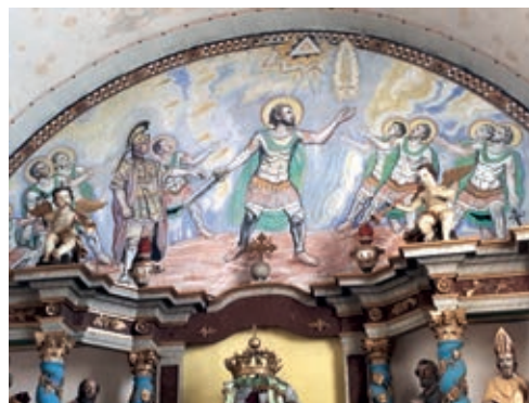
Église de Reyvroz.

Saint Maurice, patron de la paroisse de Reyvroz, était peut-être noir... Il était d'origine égyptienne, et faisait partie, avec ses compagnons coptes, de la « légion de Thèbes ». Tous chrétiens, ils sont morts pour leur foi vers 303. On le représente souvent avec une physionomie occidentale (voir photo). Mais à partir du XI e siècle, il est aussi figuré sous les traits d'un Noir, cette référence à la peau noire étant probablement issue de son nom latin, maurus, « d'origine maure ».