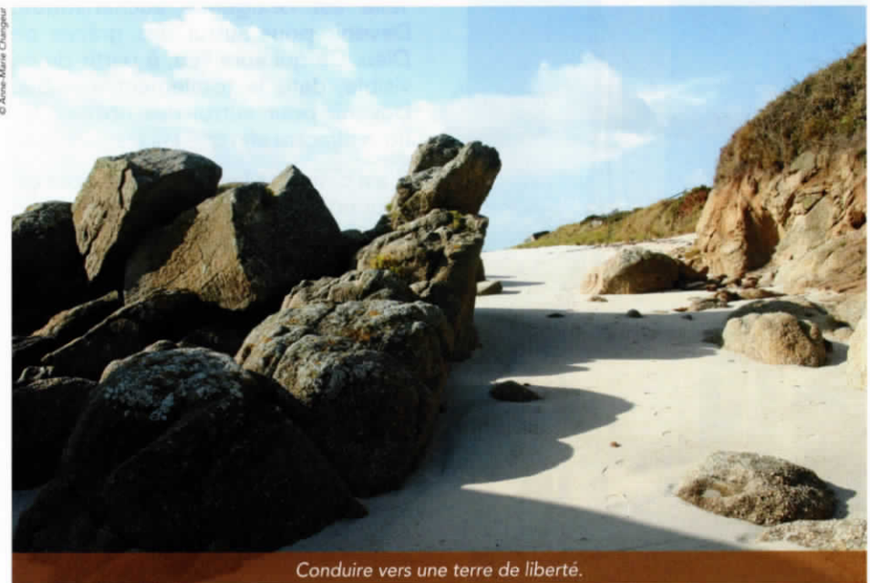
Conduire vers une terre de liberté.

Nous vous présenterons, dans la suite, quelques grandes figures de cette histoire biblique, dans cette grande histoire de la première Alliance .