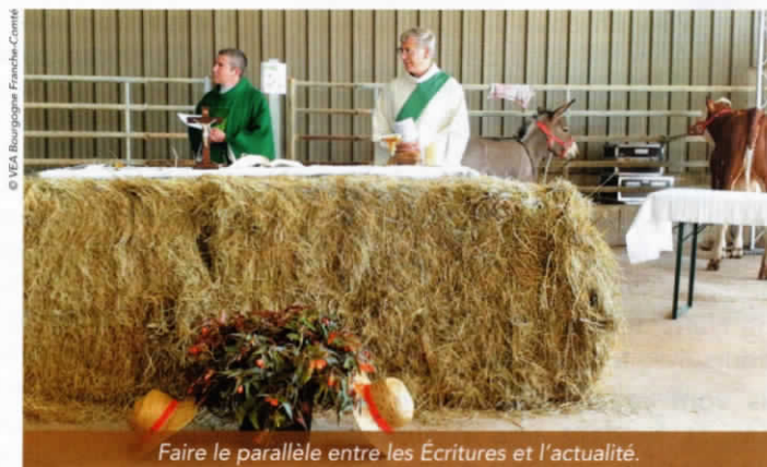
Faire le parallèle entre les Écritures et l'actualité.

Nous eûmes ensuite une courte période de lecture de textes apocryphes : Thomas, Marie de Magdala, Judas, Jean, ... Puis une reprise, par passages, du Nouveau Testament en fonction des thèmes hebdomadaires tirés d'un missel... de communion. Puis deux éphémérides du Pape François.